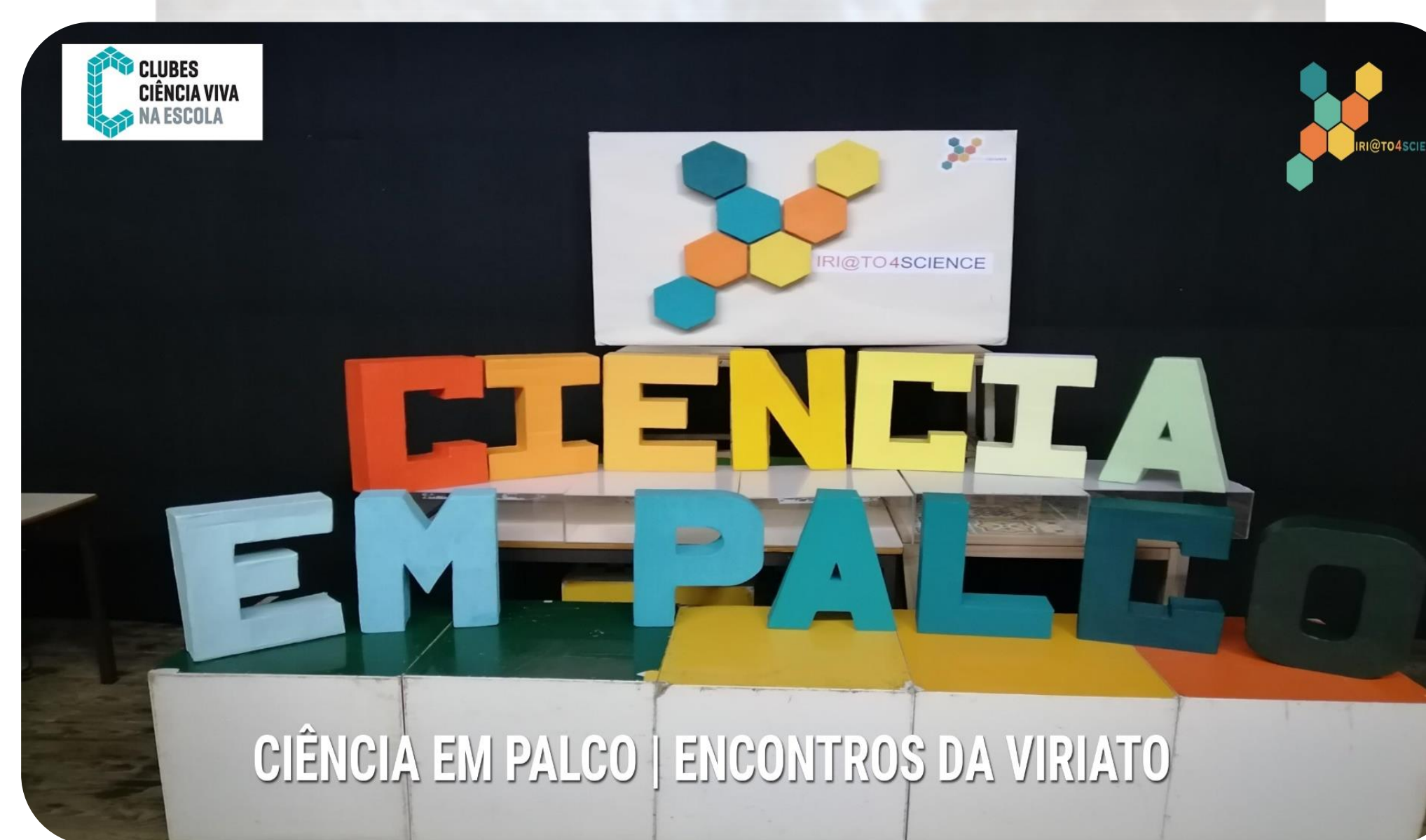
CIÊNCIA EM PALCO | ENCONTROS DA VIRIATO