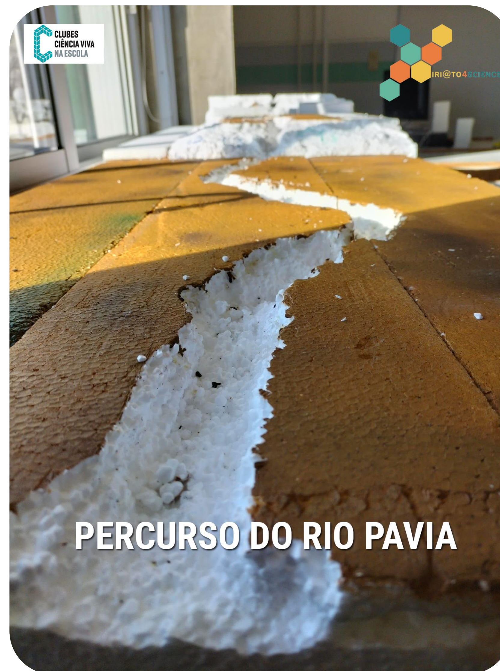
PERCURSO DO RIO PAVIA