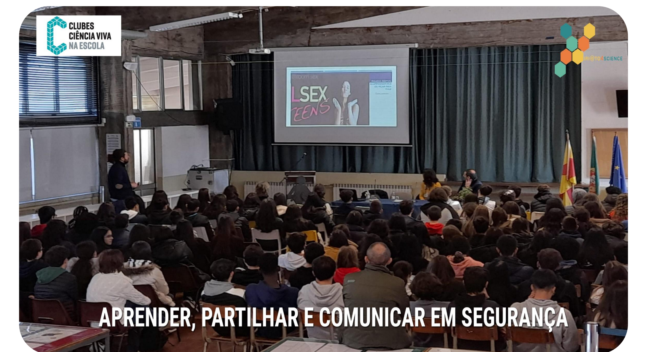
APRENDER, PARTILHAR E COMUNICAR EM SEGURANÇA