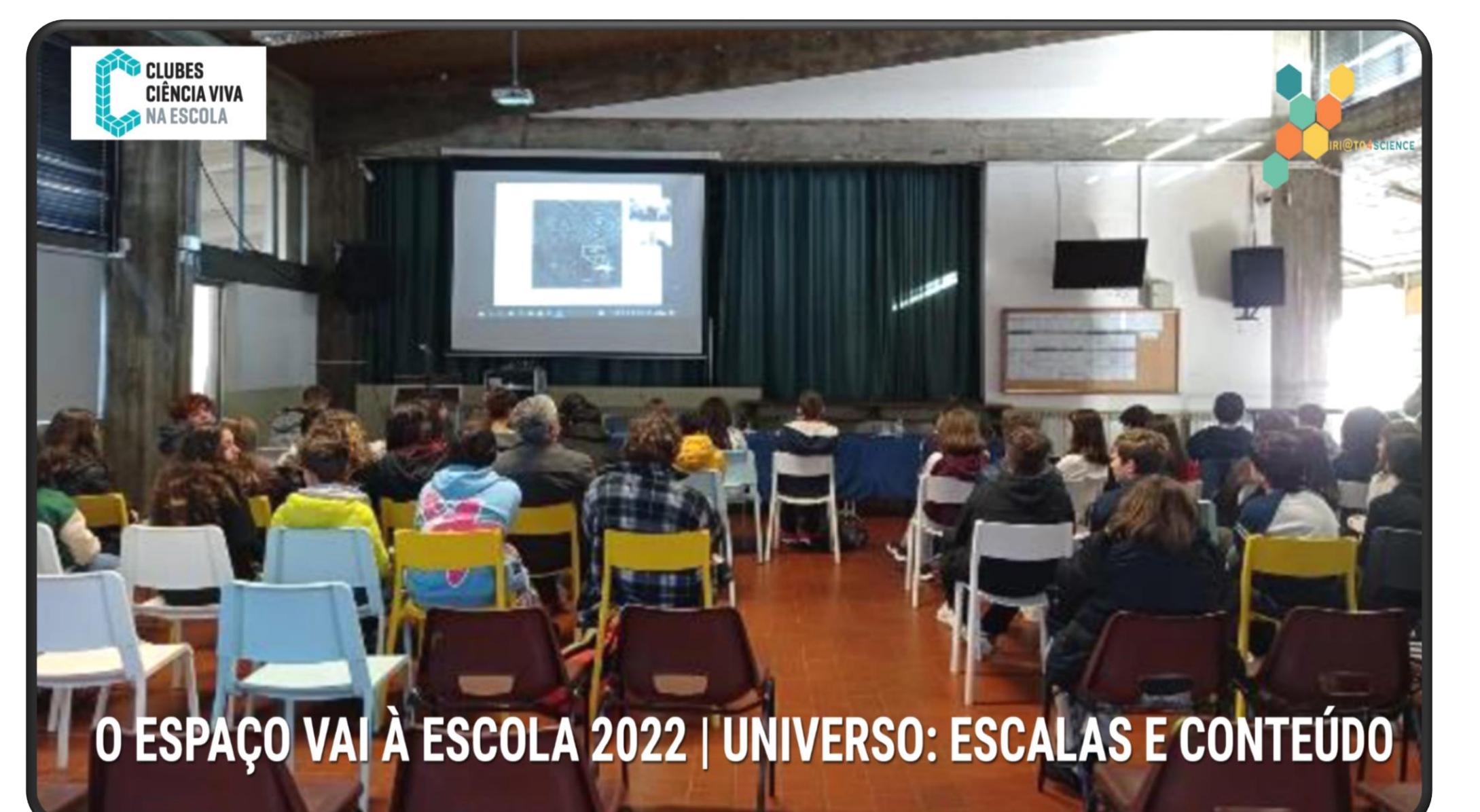
O ESPAÇO VAI À ESCOLA 2022 | UNIVERSO: ESCALAS E CONTEÚDO