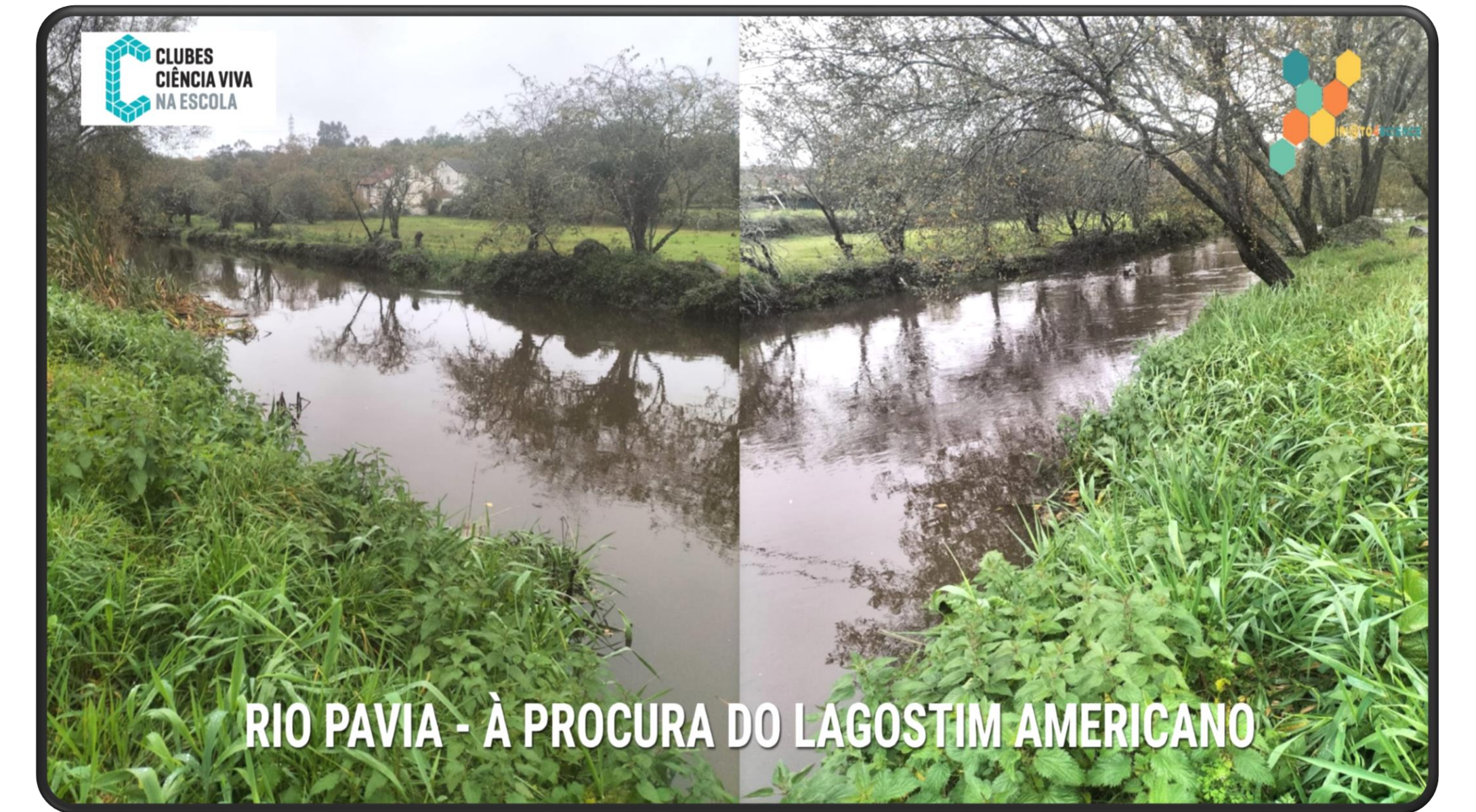
RIO PAVIA - À PROCURA DO LAGOSTIM AMERICANO