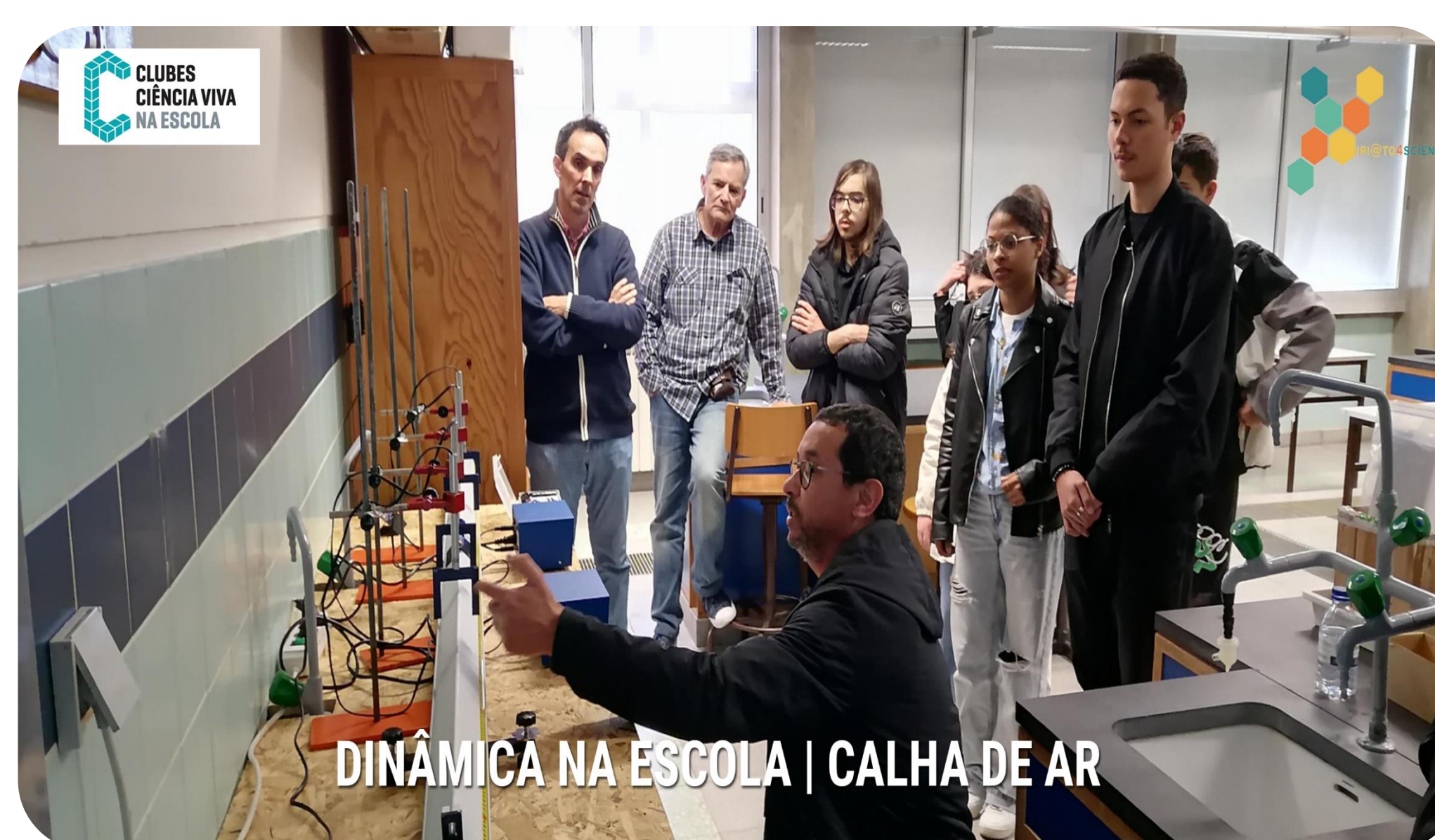
DINÂMICA NA ESCOLA | CALHA DE AR