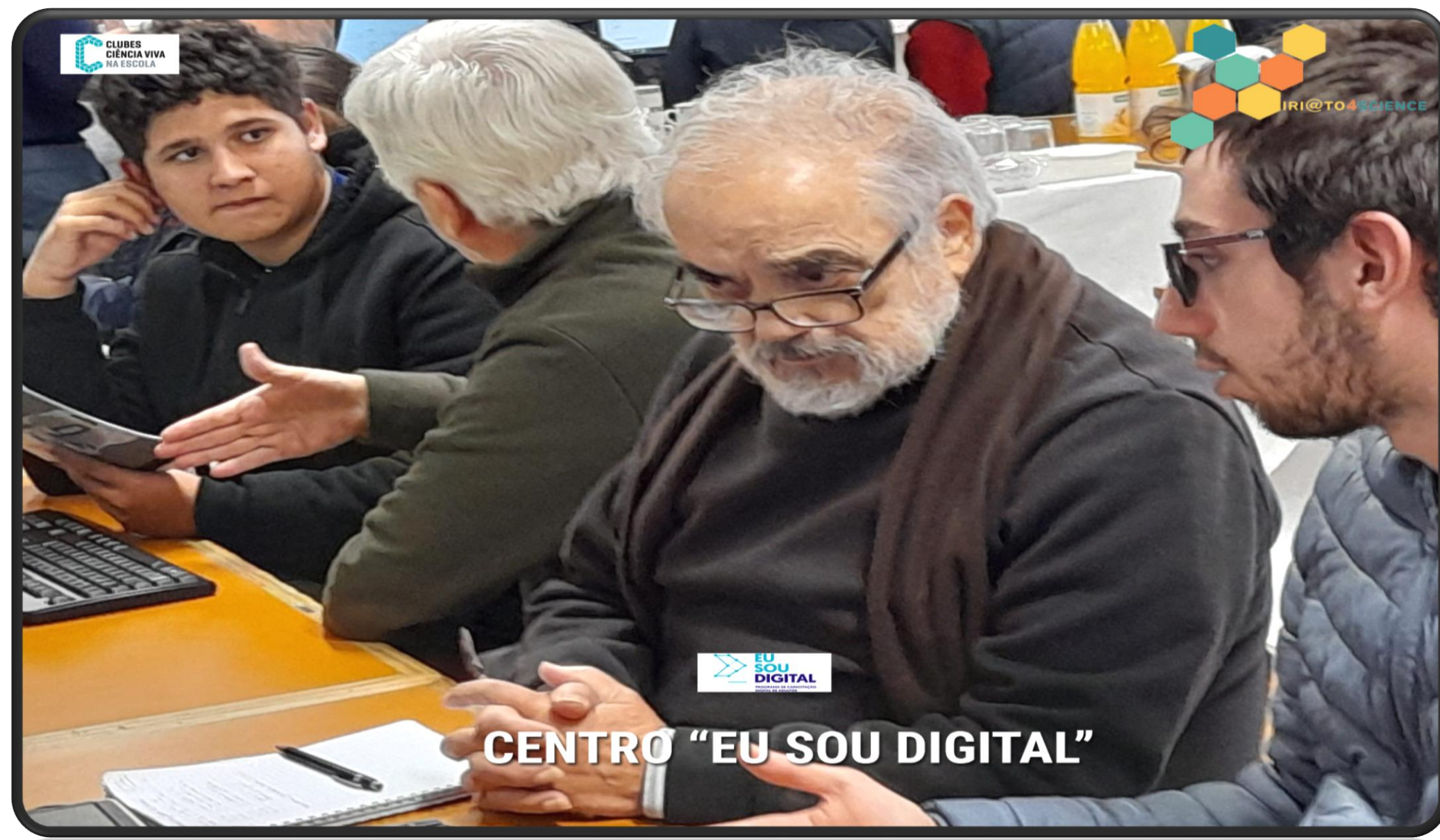
CENTRO "EU SOU DIGITAL"