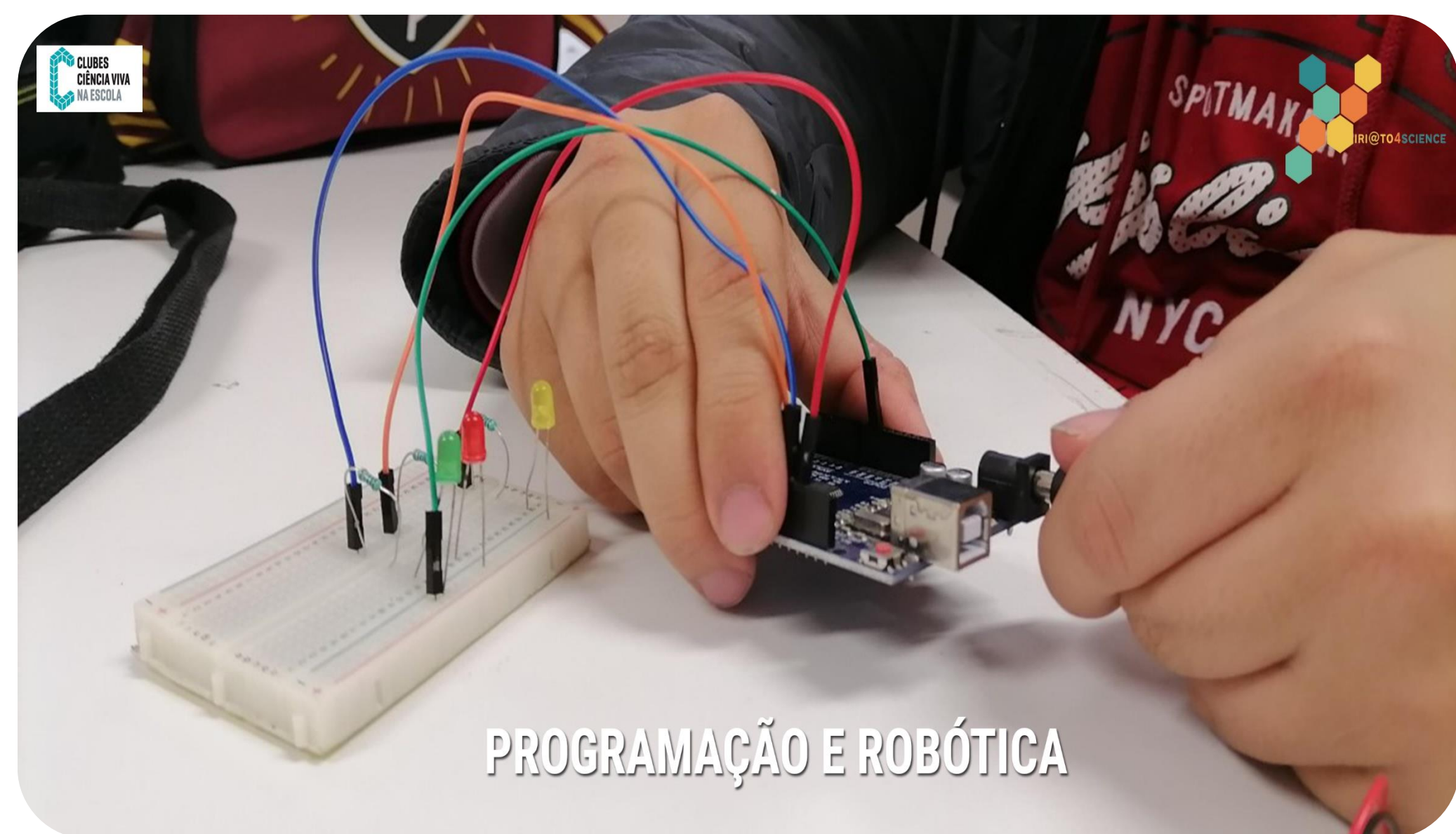
PROGRAMAÇÃO E ROBÓTICA