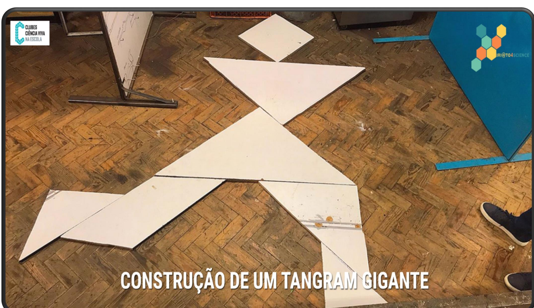
CONSTRUÇÃO DE UM TANGRAM GIGANTE