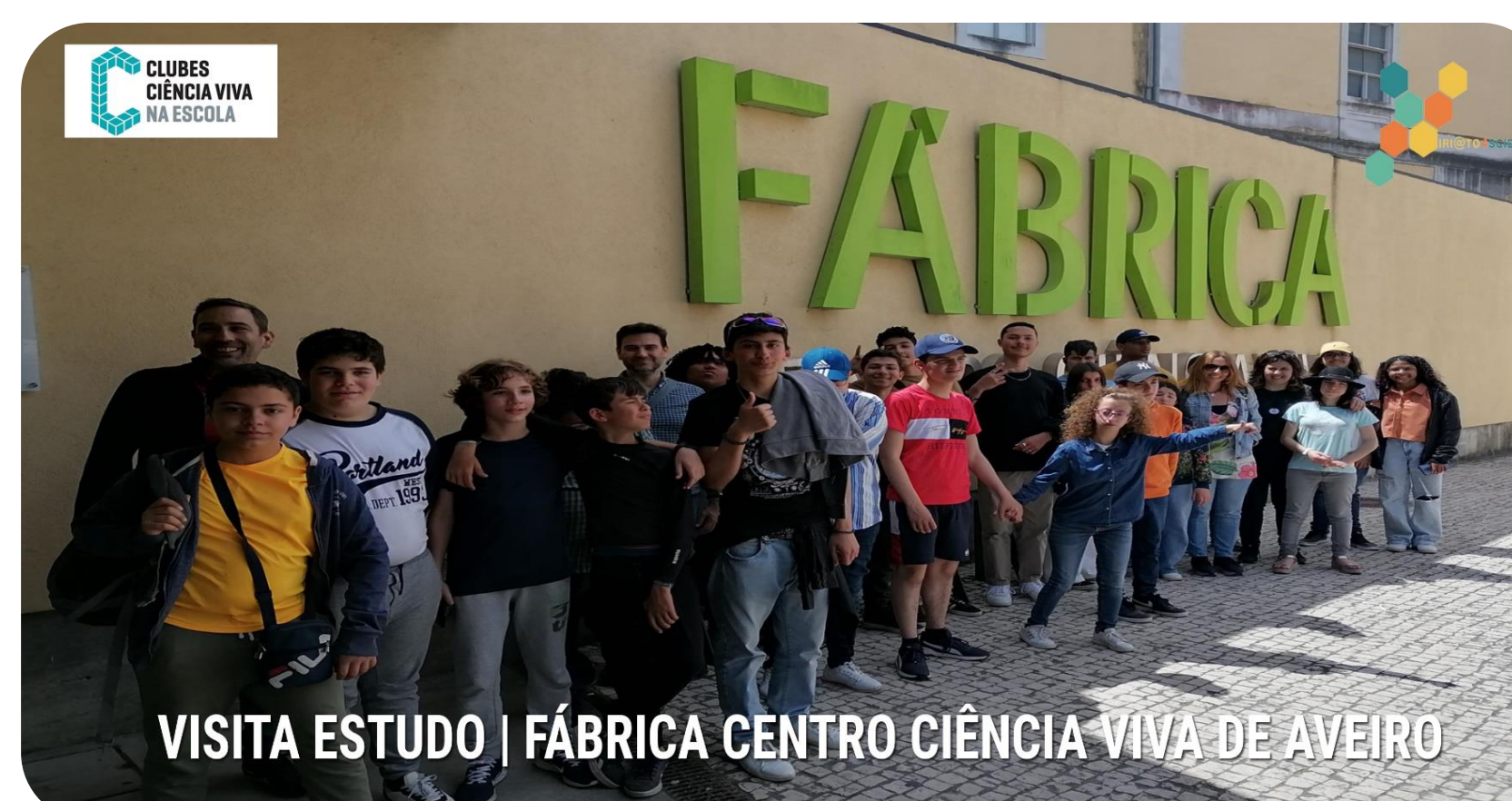
VISITA ESTUDO | FÁBRICA CENTRO CIÊNCIA VIVA DE AVEIRO