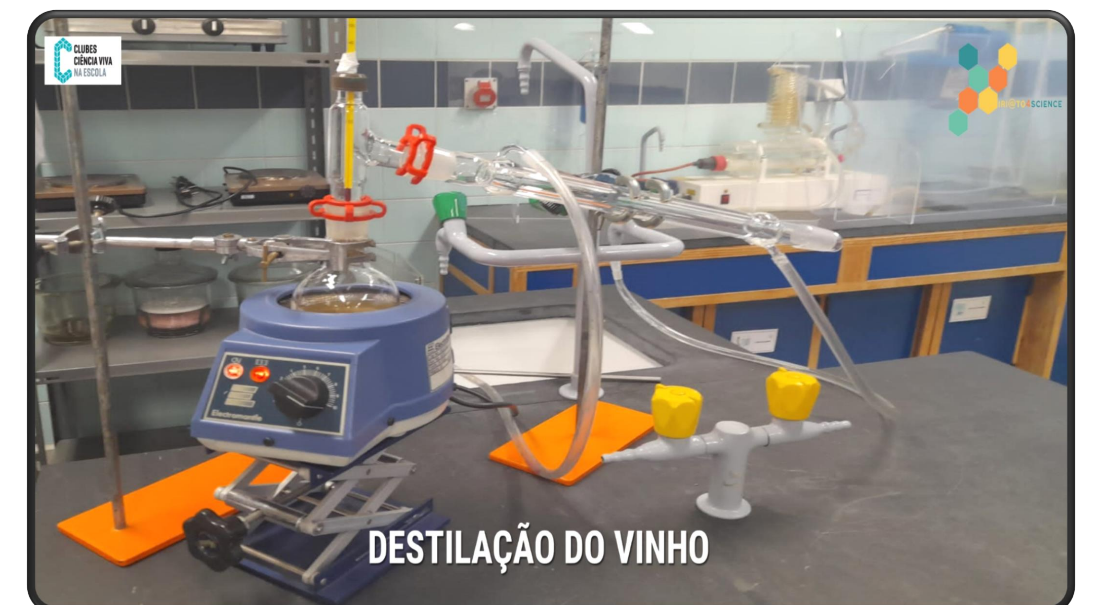
DESTILAÇÃO DO VINHO