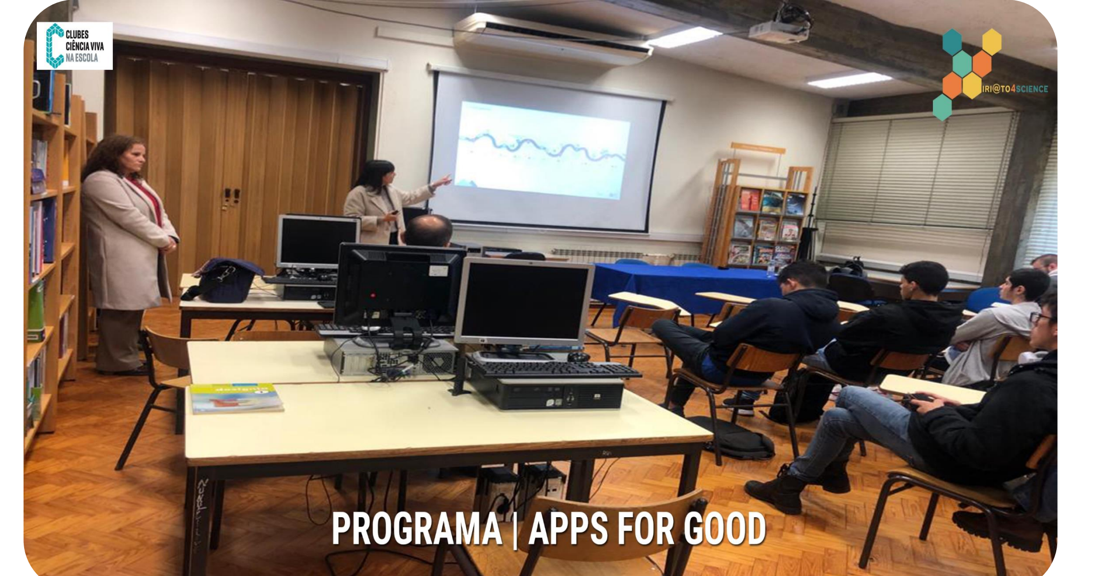
PROGRAMA | APPS FOR GOOD