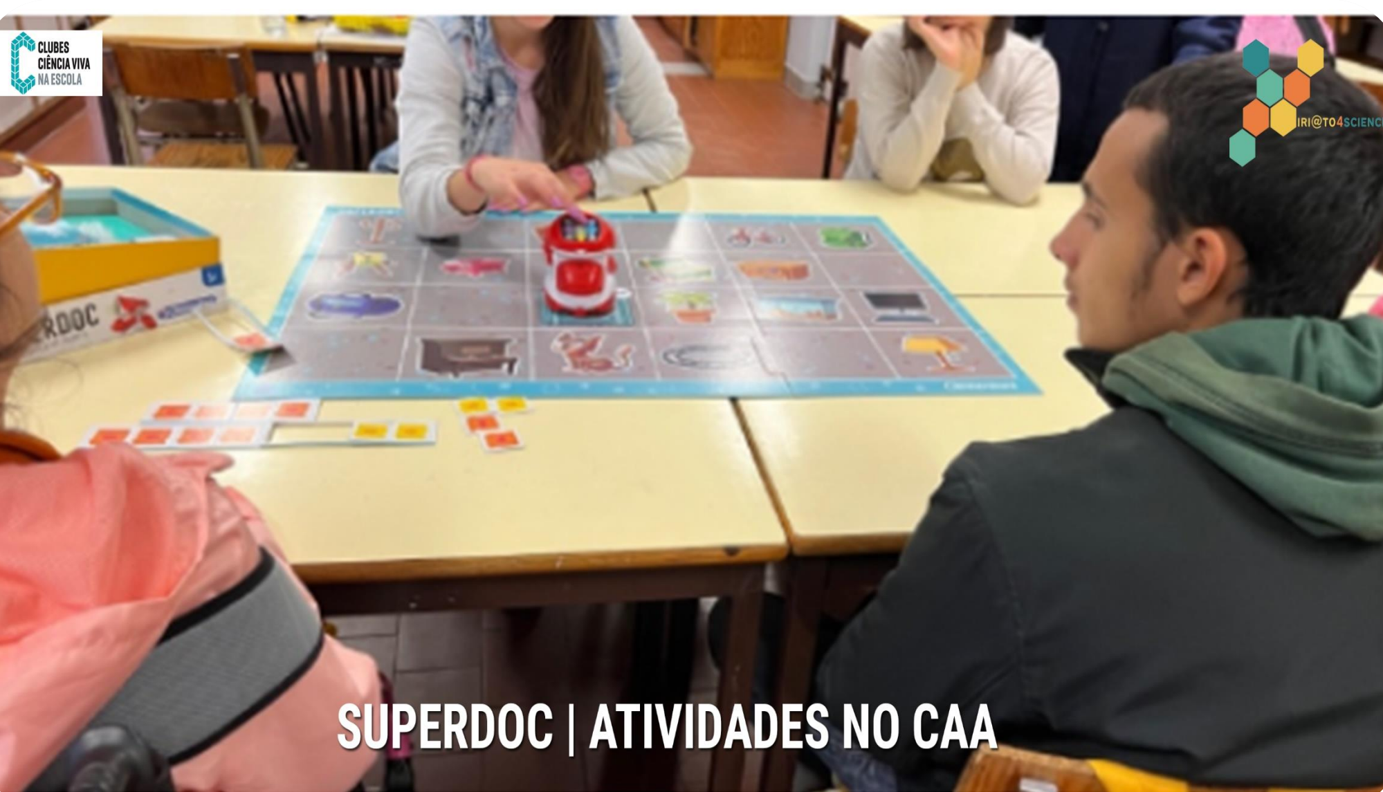
SUPERDOC | ATIVIDADES NO CAA